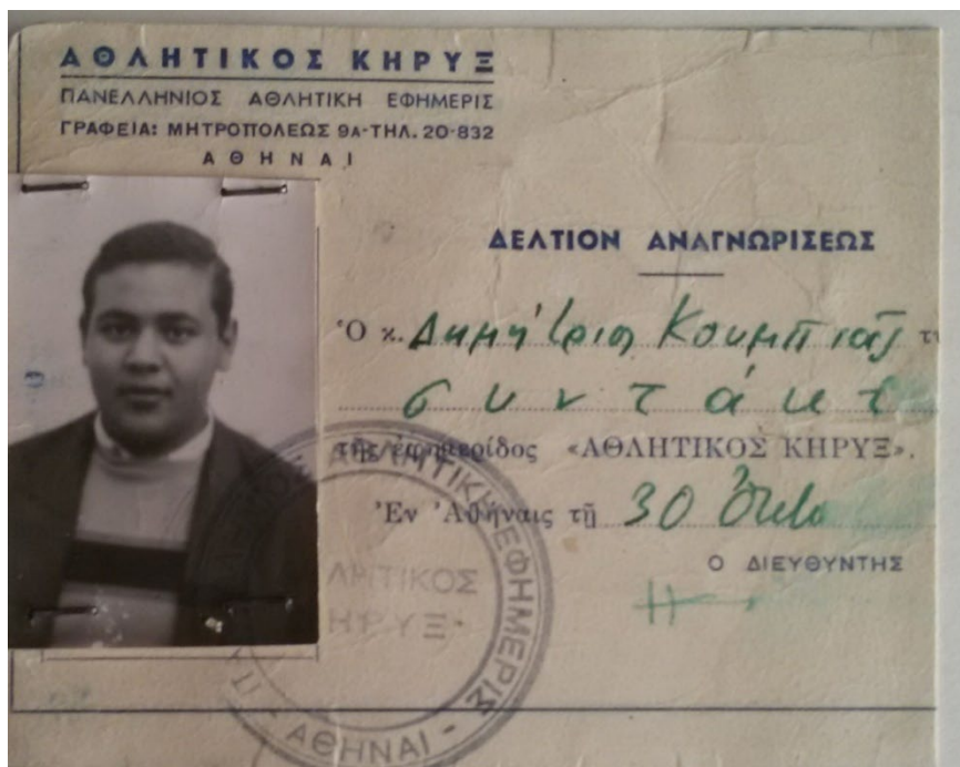
Η πρώτη μου

δημογραφική ταυτότητα, ξεθωριασμένη στην άκρη... μάλλον από τον χρόνο.